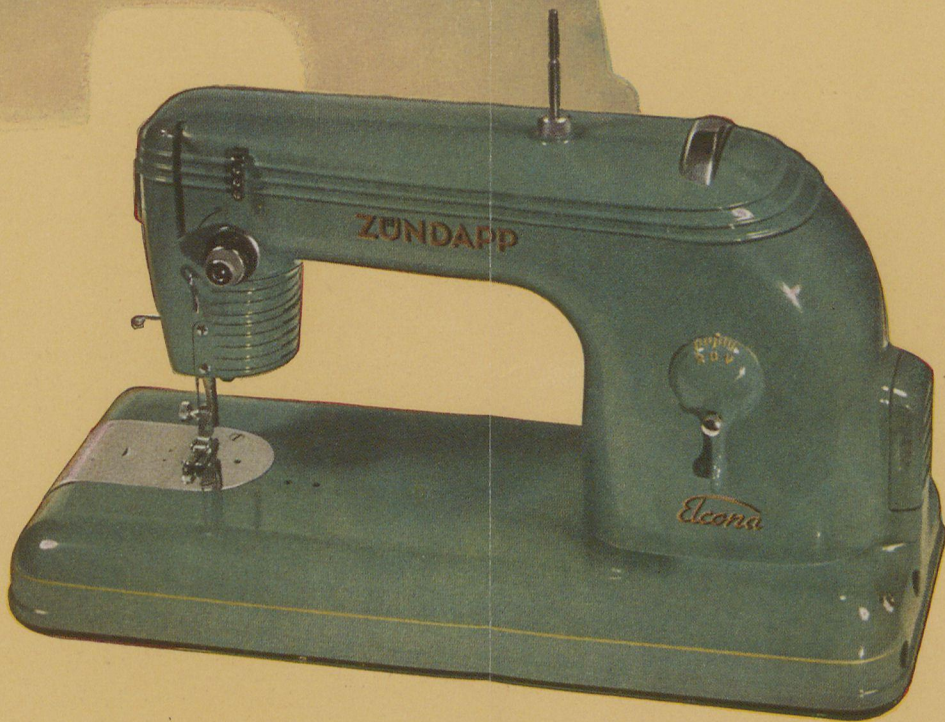
ZÜNDAPP- Elcona , elektrische Koffernähmaschine

In elegantem Koffer ist die ZÜNDAPP-Elcona die Nähmaschine, um die man Sie beneidet.